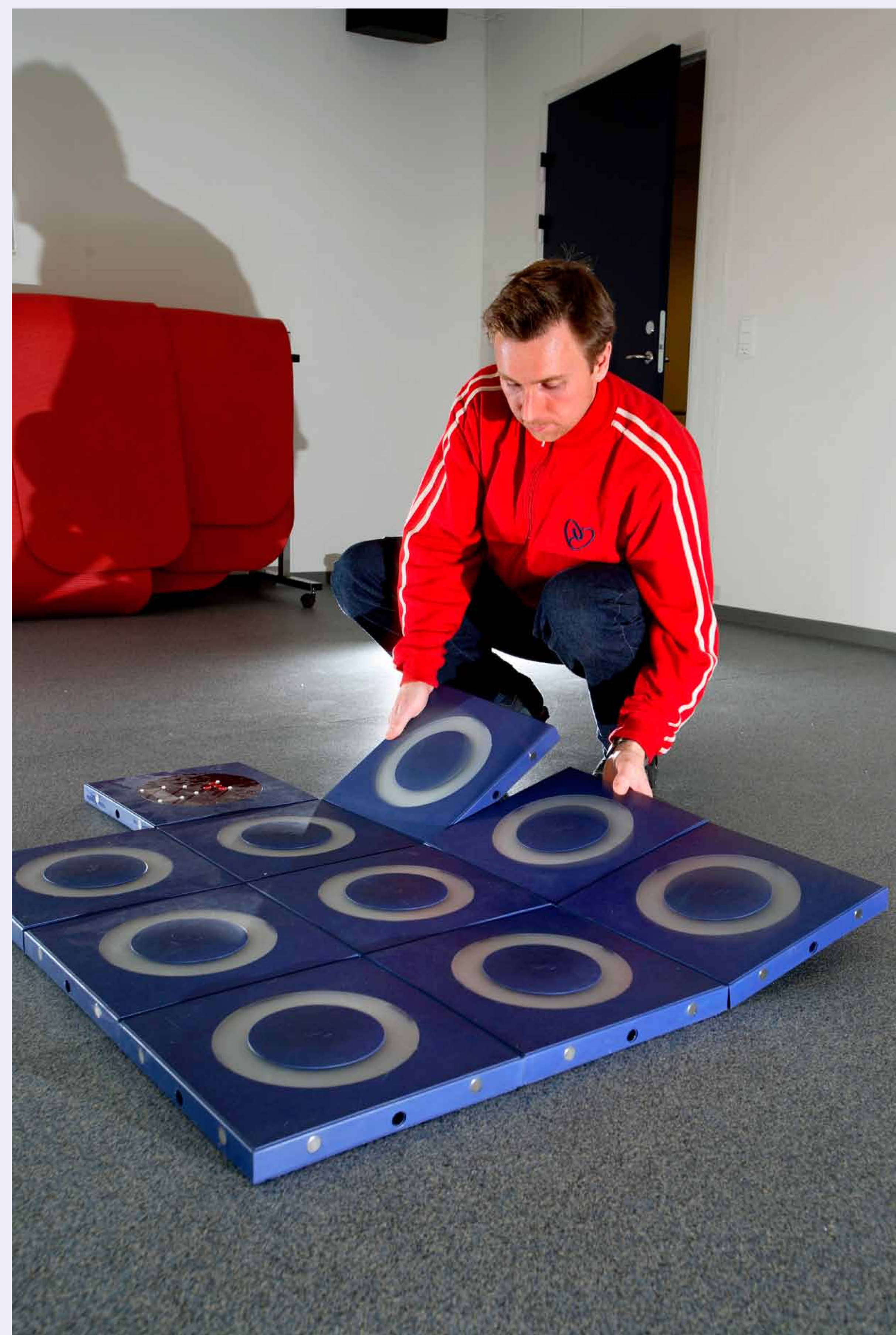
Digitale fliser til brug i fysioterapi motiverer hjertepatienter til fysisk bevægelse via leg. De er fleksible i brug og nemme at håndtere for terapeuter og brugere.

De digitale fliser har sit oprindelige afsæt i et tidligere forsknings- og udviklingsprojekt rettet mod børn og unge udført af forskere fra Center for Playware.